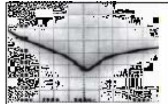
典型80-120YF 型之濾波功能, dB-頻